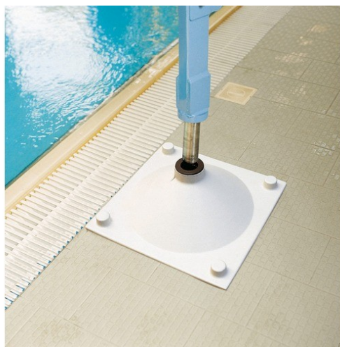
14185 BAZENSKA PLOČA