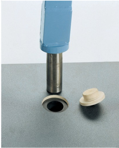
14165 BAZENSKA UTIČNICA

Fiksiranje pomoću ploče od nerđajućeg čelika, koja predstavlja kućište rotirajućeg cilindra dizalice, komplet sa ABS poklopcem.